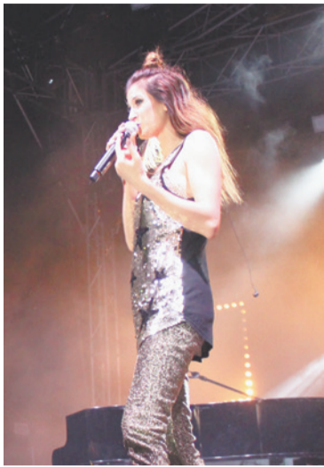
Sylwia Grzeszczak zakończyła Biesiady Kasztelańskie z mocnymi brzmieniami jak i pięknymi balladami, a wśród nich takie utwory jak: „Tamta dziewczyna”, „Sen o przyszłości” i „Dobre myśli”.

W tym roku, ponownie po 4 latach, Ciechanów znalazł się na mapie koncertowej Biesiad Kasztelańskich.