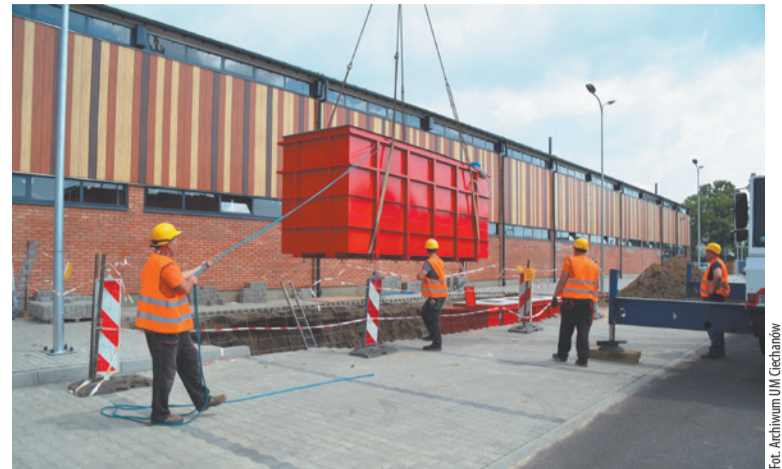
Podziemne pojemniki na odpady są montowane obok nowej hali targowej przy ul. Sienkiewicza.

Podziemne pojemniki na odpady montowane są przy ul. Sienkiewicza, obok nowej hali targowej. Gotowe będą już w sierpniu. To innowacyjne rozwiązanie, pierwszy raz zastosowane przez miasto.