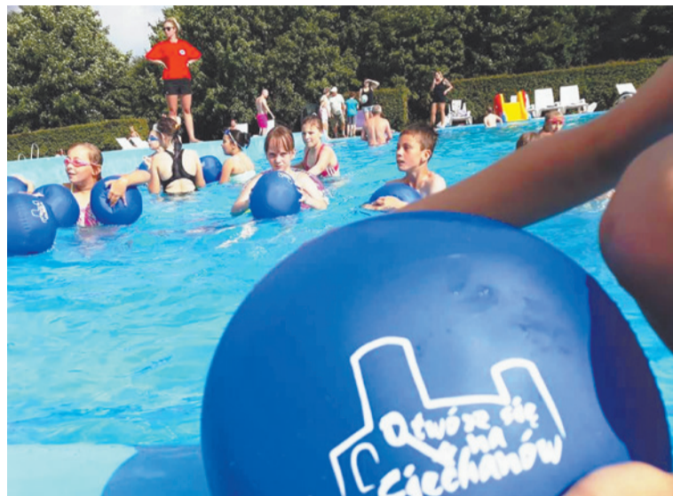
Najmłodszy uczestnicy imprezy ćwiczyli w basenie.

W lipcu na basenie odkrytym odbyła się impreza fitness zorganizowana przez Stowarzyszenie Mazovia ProActiv, MOSiR Ciechanów i Urząd Miasta Ciechanów.