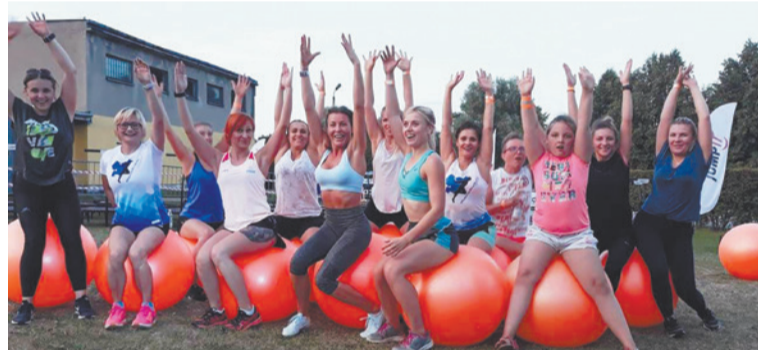
TM Trening bodyball cieszył się dużym zainteresowaniem.

Na terenie za stawkami w pobliżu kościoła św. Piotra ruszyła inwestycja, w ramach której powstanie skatepark i pumtrack. To komplementarne zadania, które złożą się na pierwszy w Polsce taki kompleks sportowy. Ciechanów pozyskał na ten cel 200 tys. zł z budżetu Województwa Mazowieckiego.