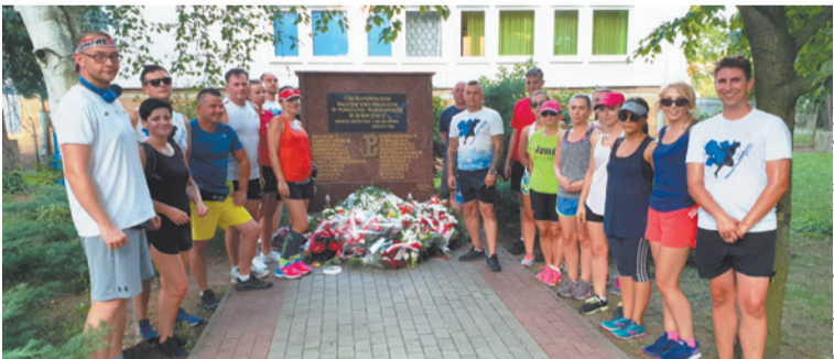
Wieczorem hołd Powstańcom oddali biegacze z Mazovia ProActiv, którzy pod pamiątkową tablicą zapalili biały i czerwony znicz.