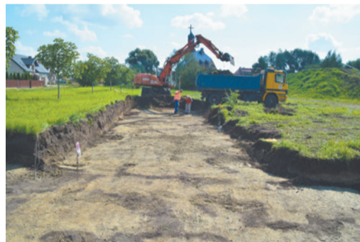
Rozpoczęła się inwestycja, w ramach której powstanie skatepark i pumtrack.

Pumtrack będzie miał 1.500 m 2 powierzchni i dwa tory. Pierwszy tor o długości 50 m i 1,4 m szerokości powstanie z myślą o dzieciach. Drugi tor o długości 150 m i 1,7 m szerokości przeznaczony będzie dla młodzieży i dorosłych, uprawiających sporty rowerowe na wyższym poziomie zaawansowania. Obydwa tory będą umożliwiały jednocześnie korzystanie z nich przez kilka osób. Konstrukcja ziemna torów będzie miała nawierzchnię