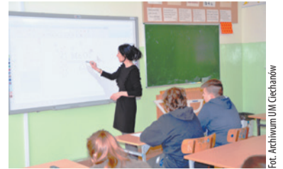
W ramach realizacji II edycji projektu „Ciechanów miastem nowoczesnej edukacji” w miejskich szkołach podstawowych organizowane będą różnorodne zajęcia dodatkowe.

To kontynuacja działań, które realizowane były w pierwszej edycji. Nowością jest zadanie z zakresu kształtowania i rozwijania kompetencji cyfrowych. – We współczesnym świecie coraz bardziej powszechna jest nowoczesna technologia. Narzędzia IT wpływają na nasz sposób komunikowania się, pracę, naukę zabawę, towarzyszą nam w bardzo wielu sferach życia, stąd w drugiej edycji projektu edukacyjnego duży nacisk na programowanie, informatykę, matematykę, czy robotykę. Zajęcia z pewnością będą ciekawe i sprawią, że ciechanowscy uczniowie będą na bieżąco z technologią i nauki ściśle okażą się dla nich lepiej zrozumiałe i bliższe. Projekt jest bardzo szeroki, skierowany zarówno do słabiej jak i bardzo dobrze radzących sobie z nauką uczniów. Ważne jest wsparcie dla uczniów, którzy borykają się z różnymi rodzajami niepełnosprawności, którzy wymagają więcej uwagi, bardziej indywidualnego podejścia i niestandardowych metod