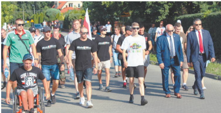
Marsz Powstania Warszawskiego.