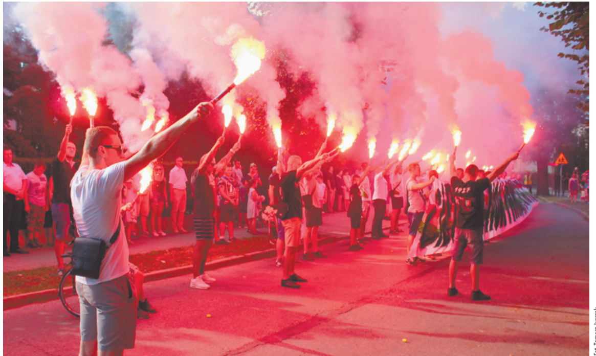
W godzinę „W” kibice odpalili czerwone race.