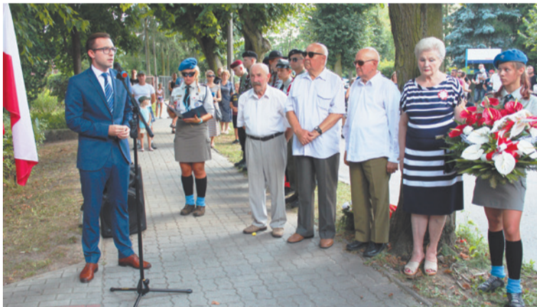
Okolicznościowe przemówienie wygłosił prezydent Krzysztof Kosiński.