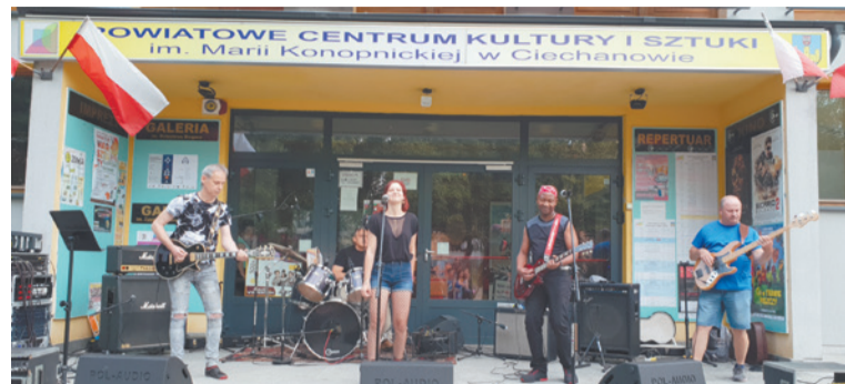
Zespół Josy dał koncert na schodkach PCKiSz.

Zespół obecnie koncentruje się na muzyce rockowej. Koncert był świetny, grali raz z mocnym