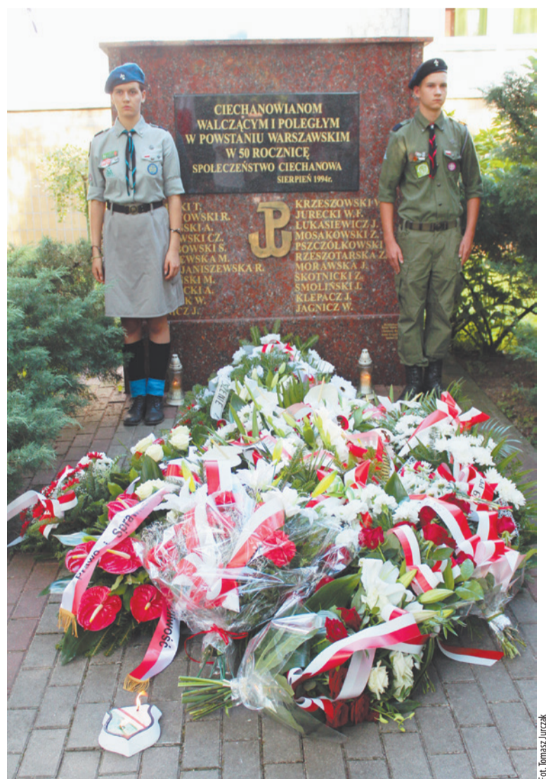
Pod pamiątkową tablicą przy ul. Powstańców Warszawskich, przy której wartę honorową zaciągnęli ciechanowscy harcerze, złożono wiązanki kwiatów i zapalono znicze.

Wieczorem w Powiatowym Centrum Kultury i Sztuki odbył się koncert