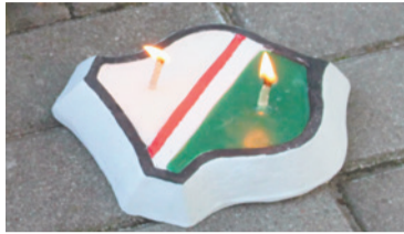
Znicz postawiony przez kibiców Legii Warszawa.

Ciechanowskie obchody rocznicy wybuchu Powstania Warszawskiego miały bogaty program i odbywały się w czterech częściach.