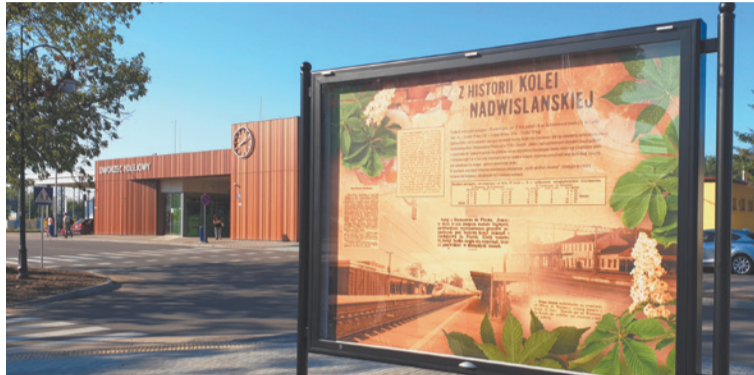
W gablotach ustawionych przed dworcem kolejowym można zapoznać się z ciekawostkami historycznymi, m.in. na temat kolei i handlu w Ciechanowie.

gablot znajdują się plany miasta z zaznaczonymi zabytkami, instytucjami, obiektami, hotelami czy postojami taksówek. Wystawę przygotowała Pracownia Dokumentacji Dziejów Miasta.