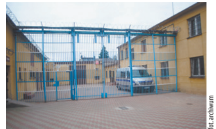
„Fałszywy wnuczek” najbliższe trzy miesiące spędzi w areszcie.

22-letni mieszkaniec Szczytna został zatrzymany przez policjantów z Ciechanowa oraz z Komendy Wojewódzkiej Policji zs. w Radomiu bezpośrednio po przekazaniu pieniędzy. 81-latkę odzyskała swoje oszczędności. Mężczyzna jest podejrzanym o 5 usiłowań i 2 oszustwa metodą na tzw. wnuczka. M.in. o oszustwo na mieszkance Ciechanowa, gdzie 79-letnia seniorka straciła znaczną sumę pieniędzy. Jak się okazało mężczyzna działał również w Łomży. Nie wykluczone, że jest zamieszany również w inne oszustwa.