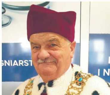
Magnificencjo, jaki był dla Uczelni kończący się właśnie rok akademicki?

Był on bardzo udany, bez obciążen pandemicznych stał się okazją do znacznej aktywności naukowej i otwartości medialnej. Organizacja sympozjów oraz konferencji naukowych dała możliwość powiększania dorobku i rozwoju naukowego kadry dydaktycznej. Ważnym wydarzeniem był udział przedstawiciela Zakładu Bezpieczeństwa w konferencji ds. wody w siedzibie głównej Organizacji Narodów Zjednoczonych w Nowym Jorku. W marcu na Wydziale Inżynierii i Ekonomii, z udziałem Rafała Romanowskiego - Wiceministra Rolnictwa i Rozwoju Wsi oraz byłego ministra Marka Sawickiego, odbyła się konferencja naukowa połączona z debatą na temat: „Przyszłość polskiego rolnictwa – szanse i zagrożenia”. Podczas konferencji prelegenci ze świata nauki i praktyki, zaprezentowali istotne problemy dla rozwoju rolnictwa.