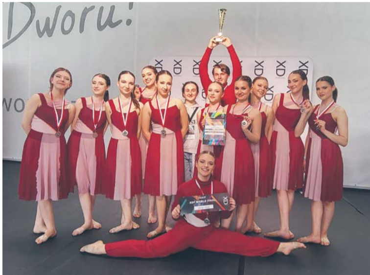
AI Grupa NOISE Tytan.