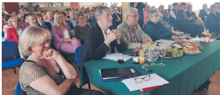
Komisja konkursowa z uwagą wysłuchiwała wszystkich muzycznych prezentacji.