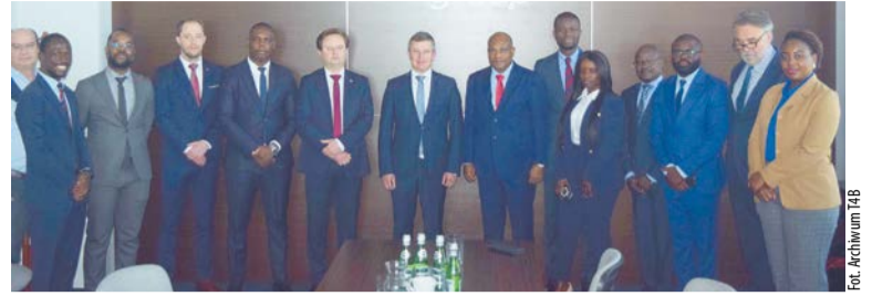
Wspólne zdjęcie zarządu T4B oraz delegacji z Republiki Angoli.

W maju firma T4B gościła w Polsce przedstawicieli administracji rządowej i służby więziennej Republiki Angoli, którzy w ramach rewizyty zawitali także do Ciechanowa.