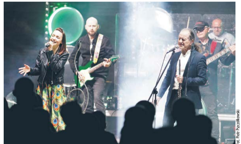
Zespół Brathanki oczarował publiczność tegorocznych Juwenaliów.

Na dziedzińcu Zamku Książąt Mazowieckich odbyły się Juwenalia Państwowej Uczelni Zawodowej im. Ignacego Mościckiego w Ciechanowie zorganizowane wspólnie z władzami miasta. Po pandemicznej przerwie wróciła wyczekiwana impreza, która integruje studentów i mieszkańców.