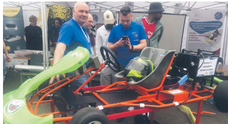
Gokart z napędem elektrycznym wykonany według projektu studentów PUZ.

Studenci Państwowej Uczelni Zawodowej im. Ignacego Mościckiego w Ciechanowie zaprezentowali zbudowany przez siebie gokart z napędem elektrycznym podczas finału Konkursu Konstrukcji Studenckich KOKOS w Krakowie.