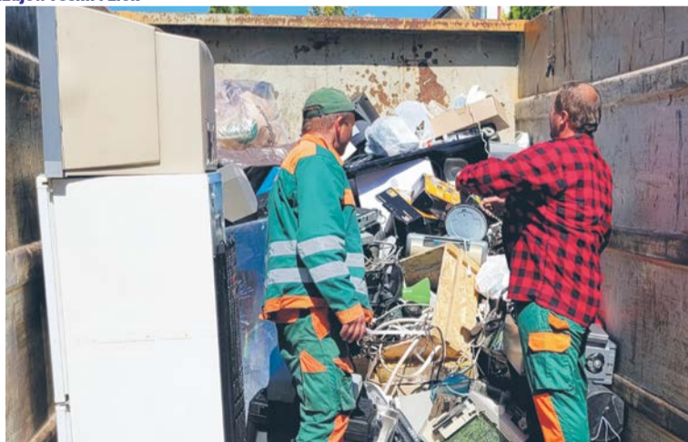
Elektrośmieci trafiły do podstawionego kontenera.

Wymiana prowadzona była przy Punkcie Selektywnej Zbiórki Odpadów Komunalnych na terenie PUK, przy ul. Gostkowskiej 83. Im większych gabarytów był oddawany sprzęt - tym więcej kuponów się otrzymywało. Później dokonywano wymiany kuponów na sadzonki. Choć było dużo chętnych do oddania elektroodpadów, to