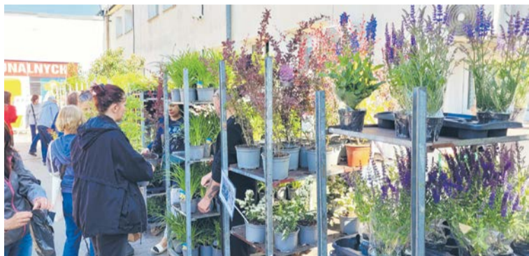
Mieszkańcy mogli wybierać spośród wielu rodzajów roślin i ziół.

Liczna grupa ciechanowian wzięła udział w proekologicznej akcji edukacyjnej „Sadzonka za elektroodpady”, zorganizowanej przez władze miasta wspólnie z Przedsiębiorstwem Usług Komunalnych.