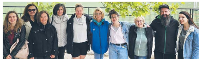
Uczniowie i nauczyciele z Ciechanowa z wizytą w greckiej szkole partnerskiej.

Uczniowie klas piątych i nauczyciele z ciechanowskiej Szkoły Podstawowej STO biorą w tym roku udział w projekcie pn. „Razem mądrzej dla Ziemi” w ramach programu Erasmus +. W maju odwiedzili szkołę partnerską w greckim mieście Acharnes. Rozwijali tam swoje umiejętności społeczne, językowe, sportowe i naukowe.