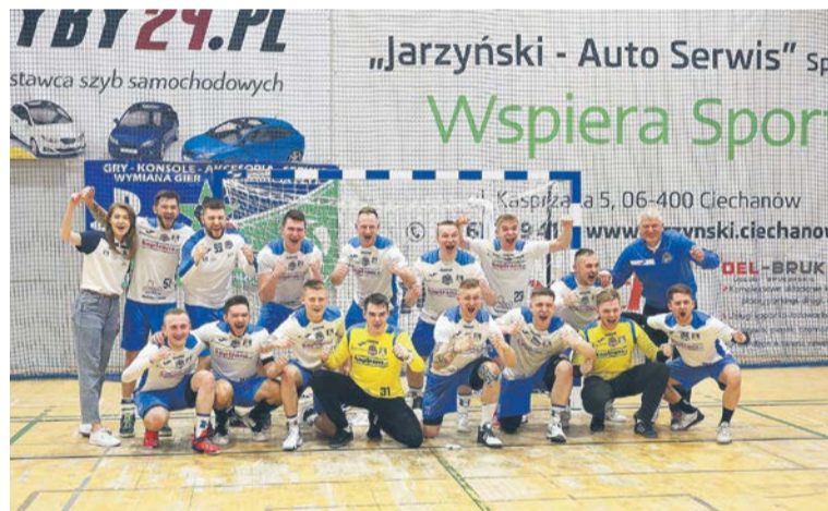
Wszyscy w Ciechanowie spodziewali się, że o sportowy awans będzie bardzo trudno.

Jeszcze większą dramaturgię przyniosło spotkanie w Zwoleniu. Jurand w ostatniej sekundzie przechylił szalę zwycięstwa na swoją korzyść, a trzy punkty dał ciechanowskiemu