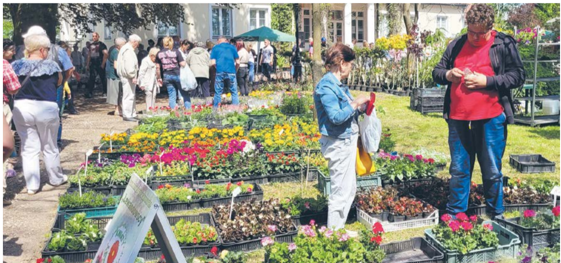
W tegorocznej edycji „Kwiatów ogrodów” wzięła udział rekordowa liczba wystawców.