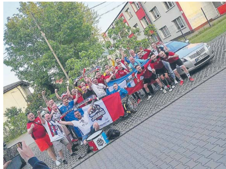
Po wygranym meczu z Unimetal Recycling MTS Chrzanów.

Nowy sezon, bez względu na klasę rozgrywkową w jakiej zagra Jurand, wystartuje we wrześniu.