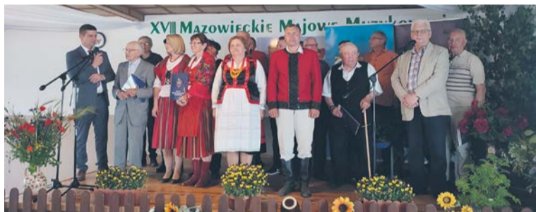
Na zakończenie wszyscy uczestnicy stanęli na scenie wraz z Wójtem Gołymina i Starostą Ciechanowskim.

W jedną z majowych niedziel wieś Watkowo w Gminie Gołymin-Ośrodek zamieniła się w stolicę ludowego muzykowania. Stało się to za sprawą kolejnej, 18. edycji Mazowieckiego Majowego Muzykowania.