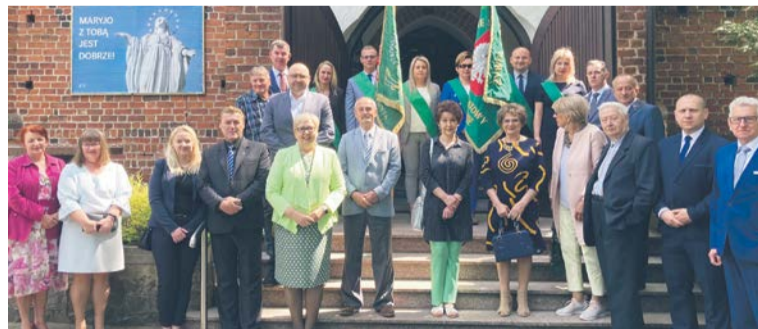
Członkowie ciechanowskich struktur Polskiego Stronnictwa Ludowego przed „Klasztorkiem”.