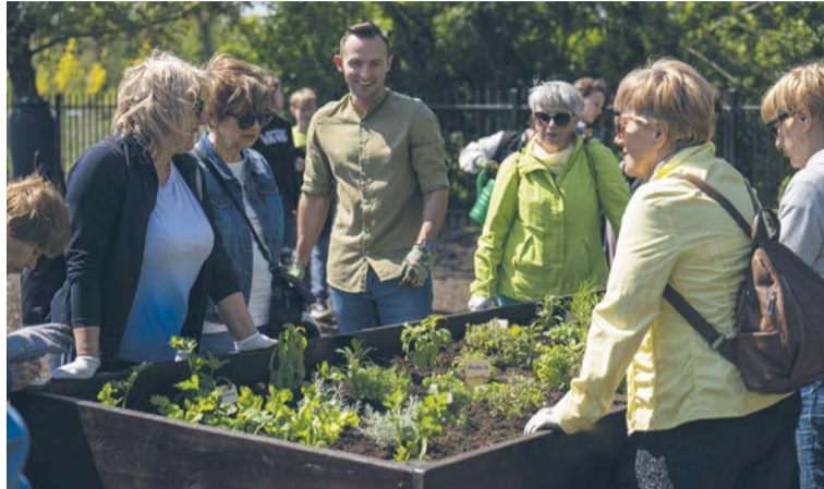
Pierwsze nasadzenia wykonali seniorzy i uczniowie, którym towarzyszył prezydent Krzysztof Kosiński.

– Rokrocznie tworzymy nowe zielone przestrzenie w Ciechanowie. Staramy się, aby były nietuzinkowe, atrakcyjne i przede wszystkim funkcjonalne. W ubiegłym roku powstała Zielona Poczekalnia przy dworcu PKP, trzy mini parki kieszonkowe na osiedlach, na placu Kościuszki mamy pierwszy zielony przystanek. Ogród społeczny nie tylko ozdobi nowy park miejski, ale przede wszystkim będzie służył miesz-