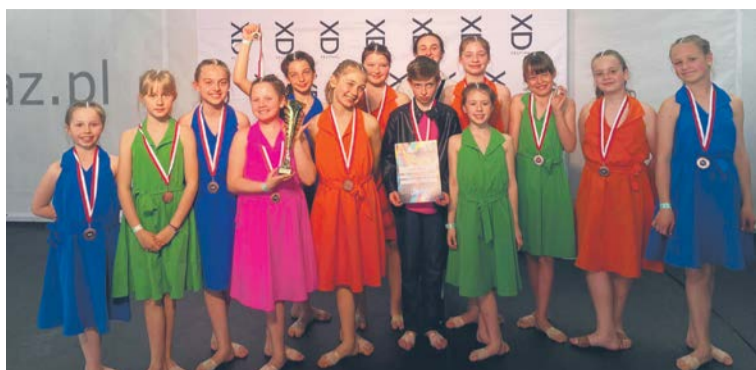
Grupa NOISE Teen.