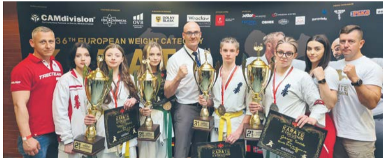
Zawodnicy Ciechanowskiego Klubu Karate Kyokushin prezentują puchary zdobyte podczas The 36th European Weight Category Karate Kyokushin Championships we Wrocławiu.

Ośmioosobowa drużyna Ciechanowskiego Klubu Karate Kyokushin (CKKK) wzięła udział w The 36th European Weight Category Karate Kyokushin Championships we Wrocławiu. Jak zawsze nasi reprezentanci wrócili z medalami.