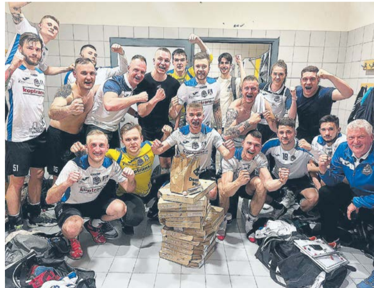
Jurand o krok o awansu do wyższej ligi.