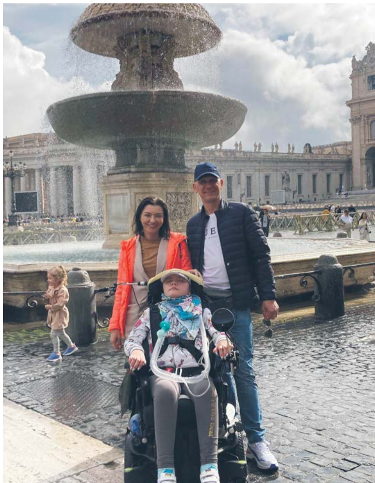
Ola z rodzicami w Watykanie.